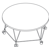
PT72 720 / 720 / 345 9.25 kg